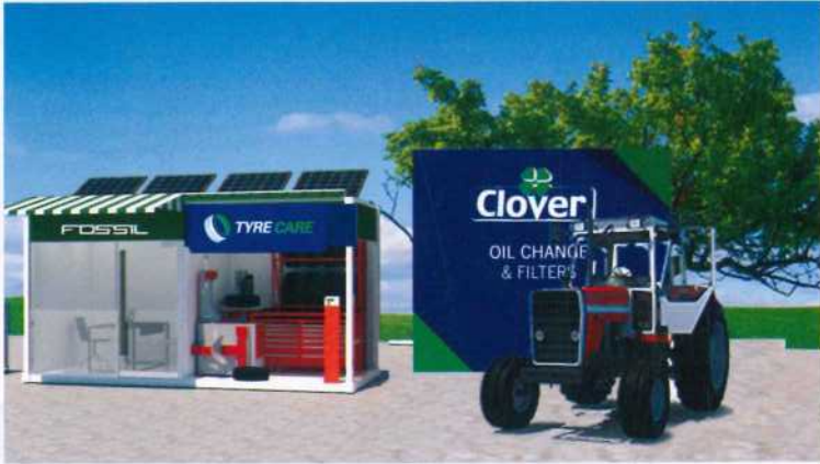
FOSSIL Fuel Station