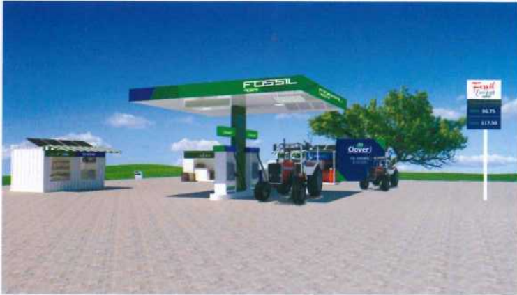
FOSSIL Fuel Station