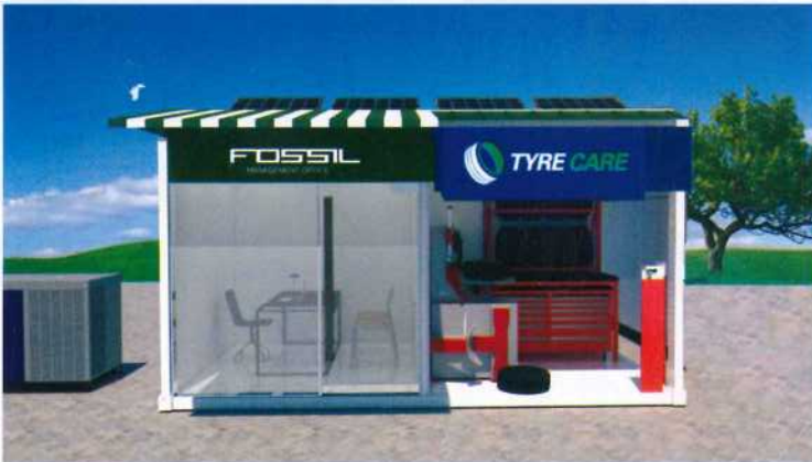
Tyre Care Unit