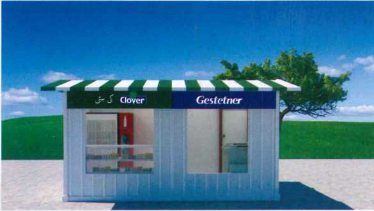
Clover ki Hatti